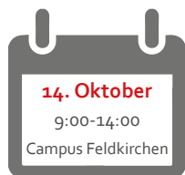
Foto-Shooting für professionelle Bewerbungsfotos am Campus Feldkirchen (Foyer, Stiegenhaus)

Sinnvolle Tipps zur professionellen Erstellung von Bewerbungsfotos und ein kostenloses Fotoshooting werden an diesem Tag angeboten.