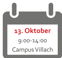
Foto-Shooting für professionelle Bewerbungsfotos am Campus Villach (Foyer)

Sinnvolle Tipps zur professionellen Erstellung von Bewerbungsfotos und ein kostenloses Fotoshooting werden an diesem Tag angeboten.